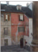
TAVOLA 20 PROGETTO